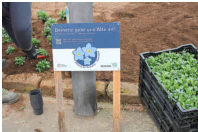
Mit der Pflanzaktion „Vergissmeinnicht“ wird auf das Thema Demenz aufmerksam gemacht.

Kontakt: Gerontopsychiatrisches Netzwerk mit Schwerpunkt Demenz im Saarpfalz-Kreis, c/o Psychosoziale Projekte gGmbH, Goethestraße 2, 66424 Homburg, Tel.: 06841 / 93 43-0.