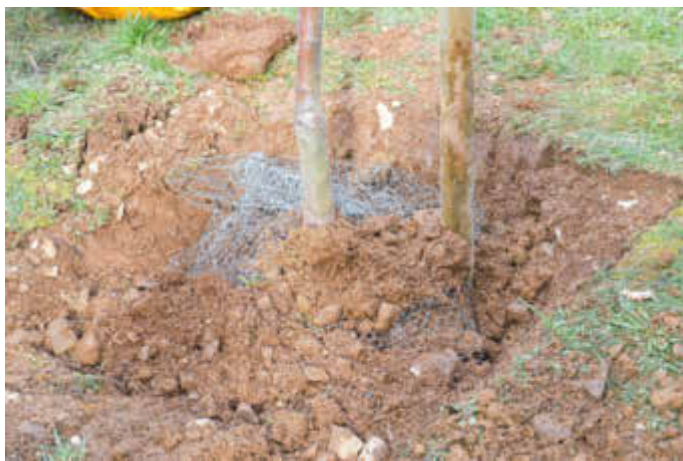
Neupflanzung mit Wühlmauskorb und Stützpfehl

Sie haben noch keine eigene Obstwiese? Oder eine Streuobstwiese zum Verkauf? Die Streuobstbörse vom Verband der Gartenbauvereine kann helfen. Inserate oder Gesuche nach Obst, Wiesen, Dienstleistungen oder Geräten können unter www.gartenbauvereine.de kostenlos eingestellt werden. https://www.gartenbauvereine.de/saarland_rheinland-pfalz/streuobst/streuobstboerse/angebote-anfragen