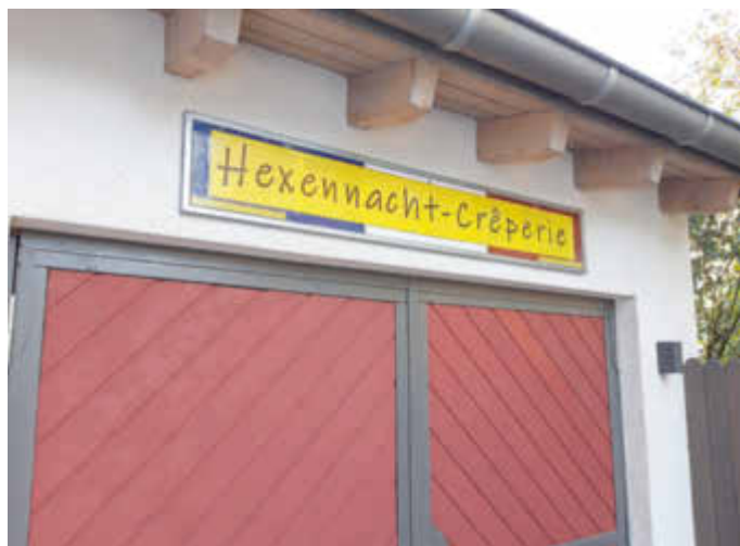
„Limbach - in der Kirchenstraße“

Besagter Schüler von 2016 hat übrigens in der Hexennacht dieses Jahres - als Corona erstmalig das Crêpesbacken verhindert hat - einen Bestellzettel für 3 Crêpes (abzuholen am 30.04.2021 in der Hexennacht-Crêperie) an unsere Haustür gehängt. Da ich intelligente Scherze von jeher mochte, habe ich die Schüler-Idee der „Hexennacht-Crêperie“ aufgegriffen und über unserer Garagentür ein Schild, mit besagtem Titel montiert.