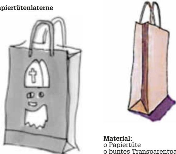
Diese Laterne kann man mit kleinen Kindern ab 1 Jahr basteln.