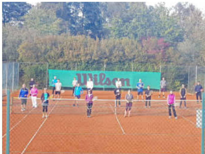
Saisonabschluss beim Tennisclub Kirkel.