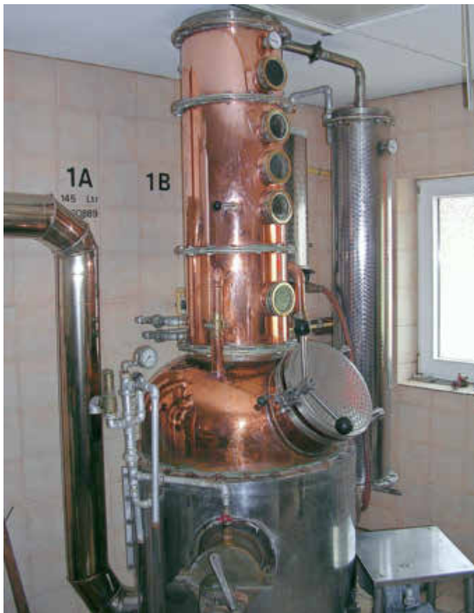
Brennerei des OGV Frankenholz

„Vom Obst zum Schnaps“ ist eine Veranstaltung des Zweckverbandes „Saar-Blies-Gau/Auf der Lohe“ und des Saarpfalz-Kreises in Zusammenarbeit mit dem Mandelbachtaler Verkehrsverein. Der Vortrag startet um 19 Uhr, die Teilnahme ist kostenfrei. Aufgrund der Corona-Pandemie ist die Teilnehmerzahl auf zwölf Personen beschränkt. Die zwingend notwendige Voranmeldung mit Angabe der persönlichen Daten ist bis spätestens 24. September 2020 beim Saarpfalz-Kreis in Homburg (Tel: 06841 / 104-7228) oder per Email haus-lochfeld@saarpfalz-kreis.de möglich. Dort gibt es auch weitere Informationen zum Angebot des Kulturlandschaftszentrums. Wegen begrenzter Parkmöglichkeiten am Veranstaltungsort wird gebeten, Parkplätze im Umfeld zu nutzen oder Fahrgemeinschaften zu bilden. Nicht im Vorfeld angemeldeten und registrierten Gästen kann kein Einlass gewährt werden.