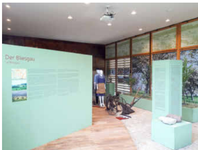
Blick in die Sonderausstellung.

Das seit Wochen schöne Sommerwetter lädt indes auch abseits der Ausstellung dazu ein, das weitläufige Freilichtmuseum im Rahmen eines Spazierganges zu erkunden.