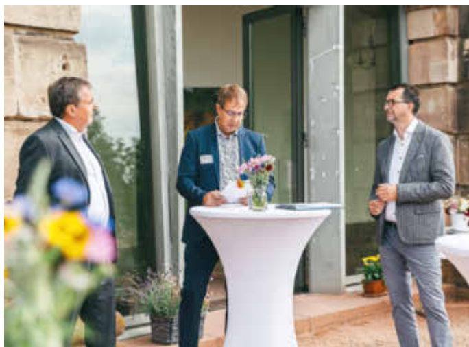
Landrat und Vorstandsvorsteher des Biosphärenzweckverbandes Bliesgau Dr. Theophil Gallo, Bürgermeister von Blieskastel Bernd Hertzler und der Minister für Umwelt und Verbraucherschutz Reinhold Jost (v.l.n.r.) stellen die Broschüre der Presse vor.

Hinter dieser Initiative steckt eine Dachorganisation, die sich mittlerweile auch „Nationale Naturlandschaften e.V.“ – früher EUROPARC – nennt und in der viele Bundesländer und Umweltverbände zusammenarbeiten. Auch das Saarland gehört dazu, ebenso wie Rheinland-Pfalz.