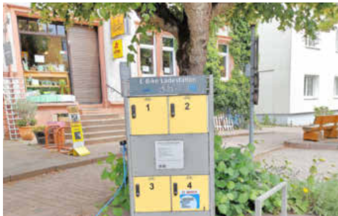
E Bike-Ladestation in der Hauptstraße in Limbach

Neuerdings gibt es an der Ladestation an der Hauptstraße in Limbach ein Schließfach, in dem ein Ladegerät für Bosch Akkus integriert ist. Das Bosch E Bike Ladegerät kann alle Bosch Akkus mit Performance Line, Performance Line CX und Active Line sowie Active Line Plus laden. Der Akkutyp wird automatisch vom Ladegerät erkannt und die Ladung entsprechend angepasst. Haftung für etwaige Schäden am Akku werden nicht übernommen.