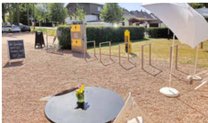
Reparaturständer am Naturfreundehaus in Kirkel-Neuhäusel

Ist Ihnen das noch nicht passiert? Sie waren mit dem Fahrrad unterwegs und hatten eine Panne. Ausgerechnet das Werkzeug, das Sie brauchten, hatten Sie nicht dabei ...Aber seit Pfingsten gibt es in der Gemeinde Kirkel Abhilfe. Dort wurden zwei Fahrradreparaturständer aufgestellt. Ein Reparaturständer steht im Ortsteil Limbach neben der E Bike Ladestation am Solarfreibad. Gleichzeitig wurden neue Fahrradabstellbügel installiert. Der zweite Reparaturständer befindet sich an der E Bike Ladestation am Naturfreundehaus in Kirkel Neuhäusel. Die beiden Reparaturständer wurden finanziell unterstützt von der LAG Biosphärenreservat Bliesgau. Ausführende Firma dieser Arbeiten war die GIU, die auch schon die E Bike Ladestationen in der Gemeinde Kirkel gebaut hat. Im Rahmen dieser Arbeiten wurde auch die Fahrradabstellanlage am Naturfreibad in Kirkel Neuhäusel erneuert. Diese Maßnahme wurde finanziell unterstützt vom Ministerium für Wirtschaft, Arbeit, Energie und Verkehr. Diese Maßnahmen sind Teil der Strategie, das Fahrradfahren in Kirkel voran zu bringen. Sollten Sie noch Ideen und Anregungen haben, wie in der Gemeinde Kirkel der Radverkehr verbessert werden kann, wenden Sie sich bitte an den Fahrradbeauftragten der Gemeinde: Armin Jung. Telefon: 06841 / 8098-60, E-Mail: a.jung@kirkel.de