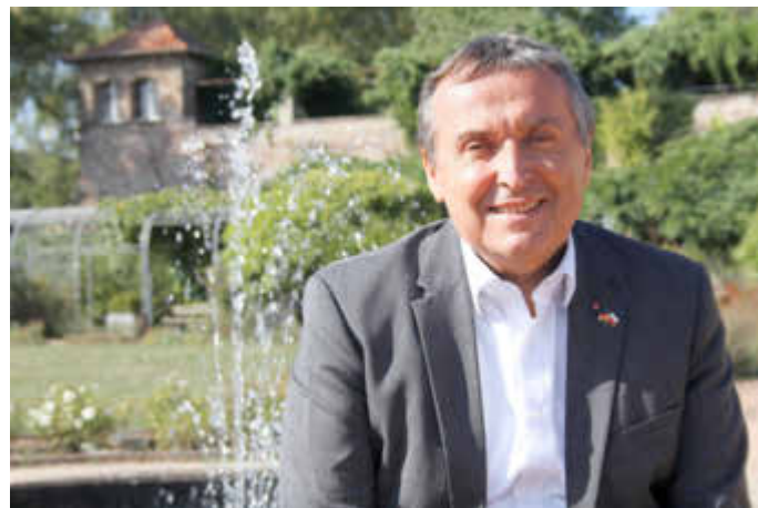
Im barocken Blieskasteler Orangeriegarten

meine Nachfolgerin/meinen Nachfolger, die auch gerne mal „dran kommen“. Die Rahmenbedingungen und die damit zusammenhängenden Herausforderungen ändern sich mittlerweile so schnell, dass es durchaus Sinn macht, die jedem Wechsel innewohnende Chance auch durch kürzere Amtsinhaberschaft zu realisieren.“