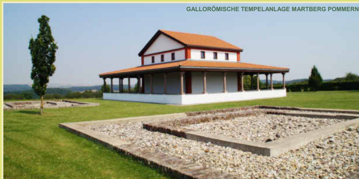
GALLORÖMISCHE TEMPELANLAGE MARTBERG POMMERN