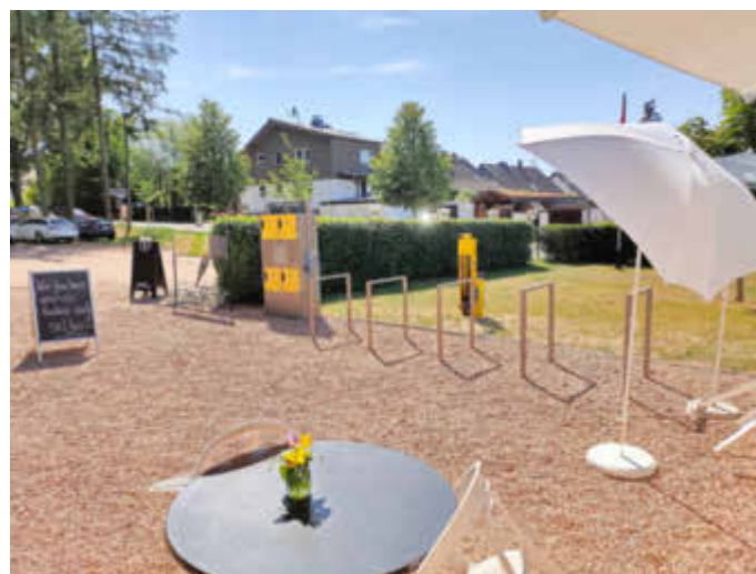
Reparaturständer am Naturfreundehaus in Kirkel-Neuhäusel

Sollten Sie noch Ideen und Anregungen haben, wie in der Gemeinde Kirkel der Radverkehr verbessert werden kann, wenden Sie sich bitte an den Fahrradbeauftragten der Gemeinde Armin Jung. Telefon: 06841 / 8098-60, E-Mail: a.jung@kirkel.de