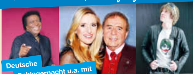
Deutsche Schlagnacht u.a. mit