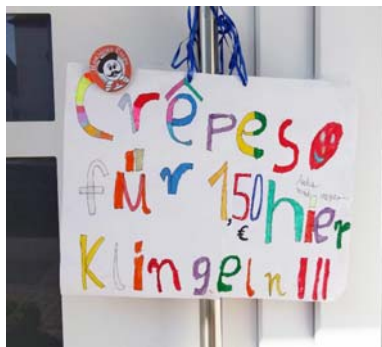
Mit diesem Schild fing alles an/Hexennacht 2016

Am Abend der „Hexennacht“ hätte sich zum vierten Mal eine Tradition geäußert, die vor Jahren durch einen pffiffigen und intelligenten Hexennachtstreich eines ehemaligen Schülers von mir ihren Anfang genommen hatte.