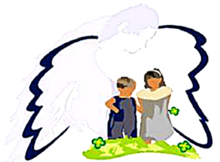
Blieskasteler Freunde und Helfer Schutzengel für Kinder e.V.

66440 Blieskastel-Lautzkirchen, Florianstraße im Stadion des SC Blieskastel-Lautzkirchen e.V.