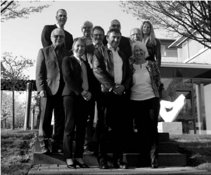
Der Aufsichtsrat der Wirtschaftsförderungsgesellschaft Saarpfalz mbH