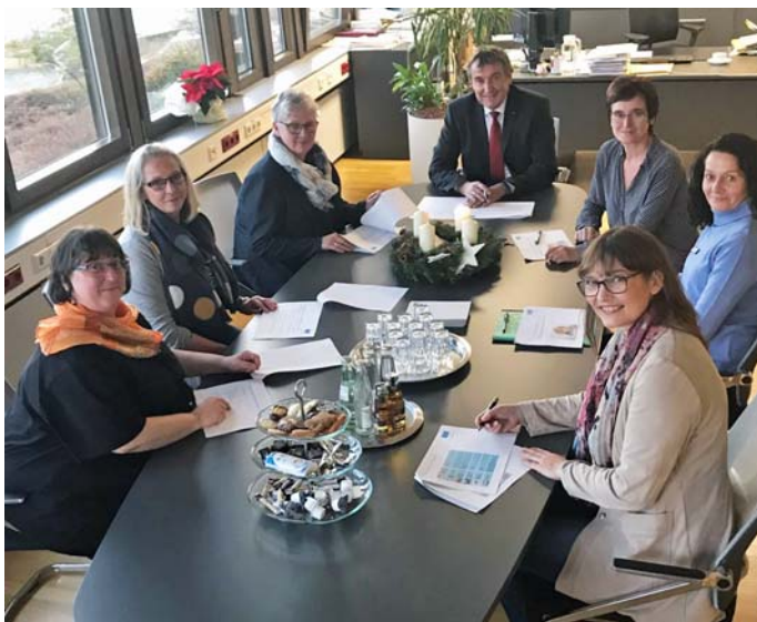
Vertreterinnen des Kinderschutzbundes Landesverband Saarland e. V. informierten sich über das Bildungs- und Teilhabepaket im Saarpfalz-Kreis.

Mehr Informationen zum Bildungs- und Teilhabepaket gibt es unter www.saarpfalz-kreis.de/buergerservice/leistungen .