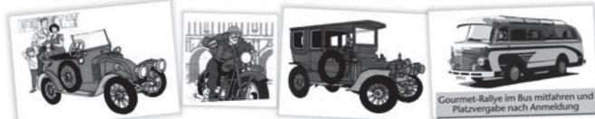
Gourmet-Rallye im Bus mitfahren und Platzvergabe nach Anmeldung