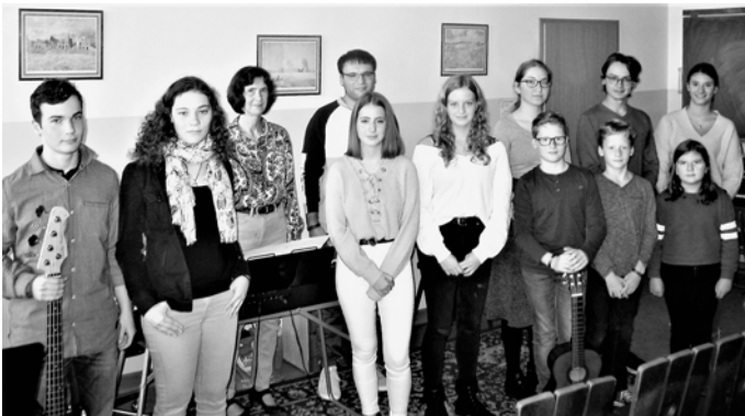
Die Interpreten der „Musikschulen Blieskastel und Kirkel“

Die „Musikschulen Blieskastel und Kirkel“ laden am 20.12. um 18.00 Uhr zu einem stimmungsvollen Liederabend in die Elisabeth-Kirche ein. Auf dem Programm stehen bekannte und internationale Werke. Die Aufführung findet im Rahmen des Lebendigen Adventskalenders statt und richtet sich an alle Altersgruppen.