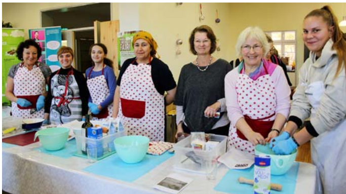
Die Vorbereitungen für das gemeinsame Backen mit fair-regionalen Zutaten sind getroffen.