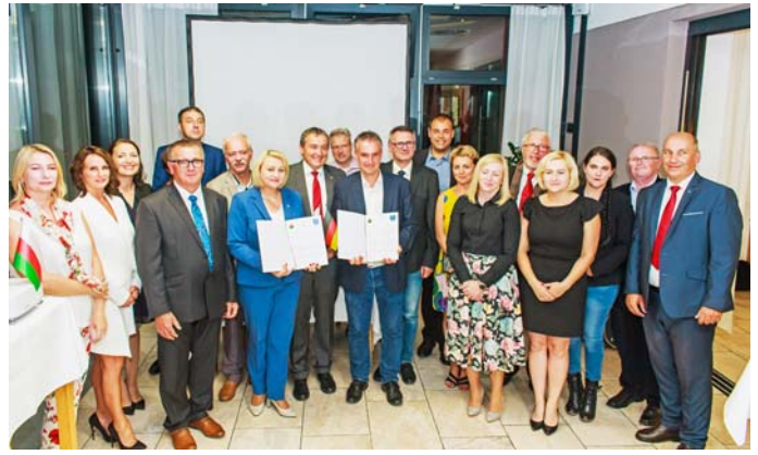
Gruppenfoto der Delegation nach Unterzeichnung der Absichtserklärungen.

Bitte beachten Sie, dass der Annahmeschluss in der Regel 15 Minuten vor Ende der Öffnungszeiten liegt, um eine Abfertigung bis zur Schließzeit zu gewährleisten.