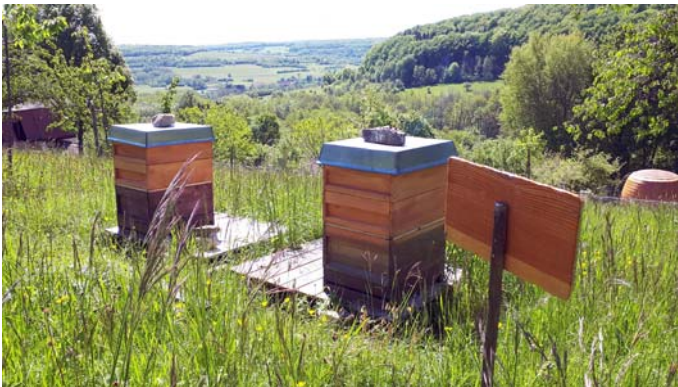
Bienenvölker in der Streuobstwiese von Haus Lochfeld mit Blick ins Tal