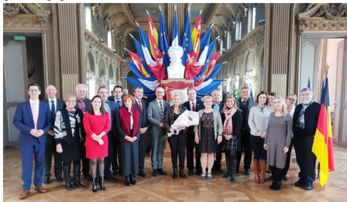
Teilnehmerinnen und Teilnehmer der Generalversammlung der EuRegio im Rathaus von Nancy

Durch unterschiedliche Initiativen möchte Gallo zusammen mit den kommunalen Politikern der EuRegio einen gemeinsamen Arbeitsraum schaffen, um europakritischen Tendenzen sachlich und stringent entgegenzuwirken.